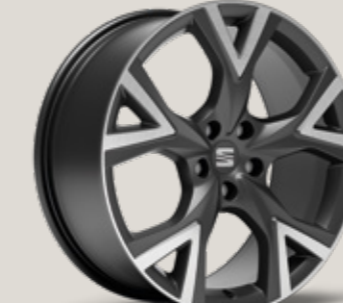
19" COSMO GRİ EXCLUSIVE 36/9 MACHINED FR