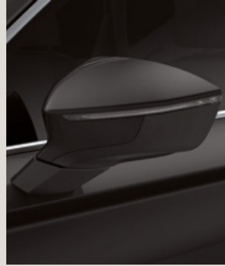
MAGIC SİYAH 2