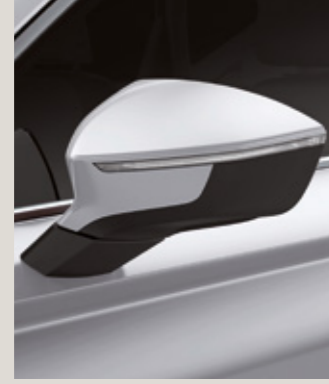
NEVADA BEYAZ 2