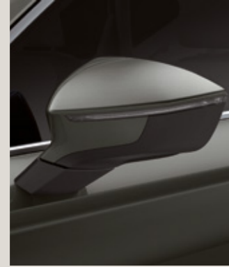
KAMUFLAJ YEŞİLİ 3