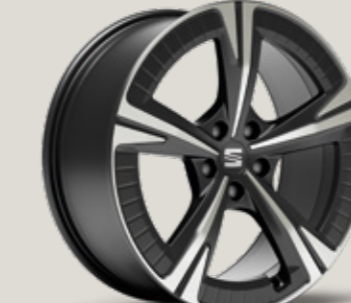
19" AERO COSMO GRİ EXCLUSIVE 36/6 MACHINED FR