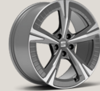
19" AERO NÜKLEER GRİ EXCLUSIVE 36/5 MACHINED XP