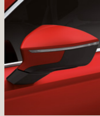
VELVET KIRMIZI 3