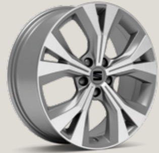
18" NÜKLEER GRİ PERFORMANCE 36/2 MACHINED XP