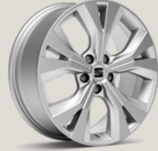
18" GRİ PERFORMANCE XP