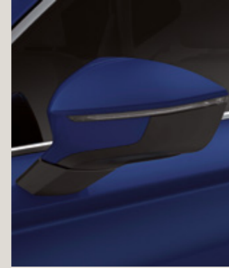
ENERJİ MAVİ 1