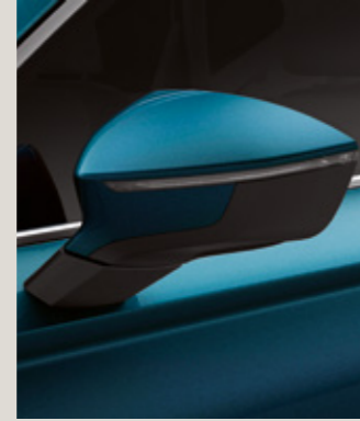
LAVA MAVİ 2