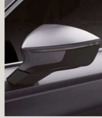
GRAFİT GRİ 2