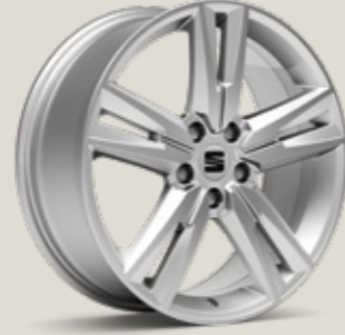
18" GRİ PERFORMANCE FR