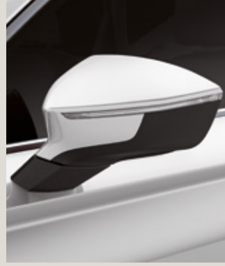
BILA BEYAZ 1