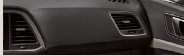
GRİ / SİYAH KUMAŞ / DINAMICA®