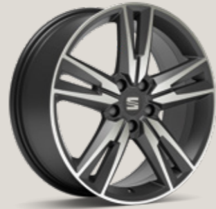
18" COSMO GRİ PERFORMANCE 36/3 MACHINED FR