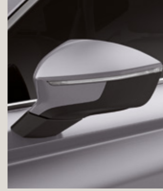
BRILLIANT GÜMÜŞ GRİ 2