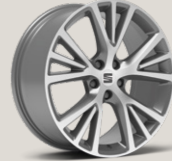
19" AERO NÜKLEER GRİ EXCLUSIVE 36/4 MACHINED XP