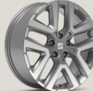
18" NÜKLEER GRİ PERFORMANCE 36/8 MACHINED XP