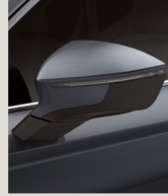
RODYUM GRİ 2