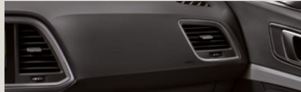
KIRMIZI DİKİŞLİ SİYAH KUMAŞ / DINAMICA®