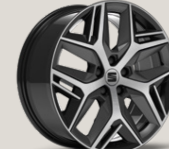
19" PARLAK SİYAH EXCLUSIVE 36/10 FR